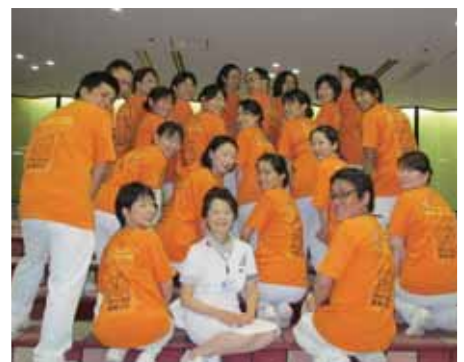
藤田保健衛生大学病院専門・認定看護師会