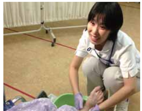
フットケアを施す糖尿病看護認定看護師