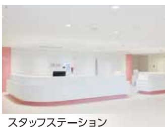
スタッフステーション