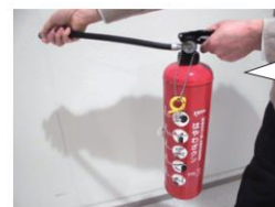
③レバーを強く握って放射する