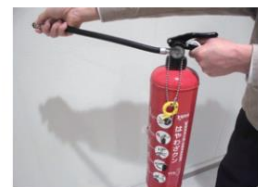
②ホースを外して火元に向ける