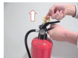
①安全ピン（黄色）に指をかけ、上に引き抜く