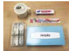
メディカルセット