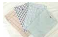
入院ねまきレンタル