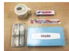
メディカルセット

入院ねまきレンタル・オムツセット・ メディカルセットをご利用ください。 特に手術される方にはお勧めです。 入院荷物の削減にもつながります。