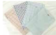
入院ねまきレンタル